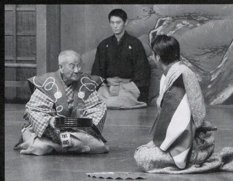
昨年の萬狂言大阪公演より「鶯」