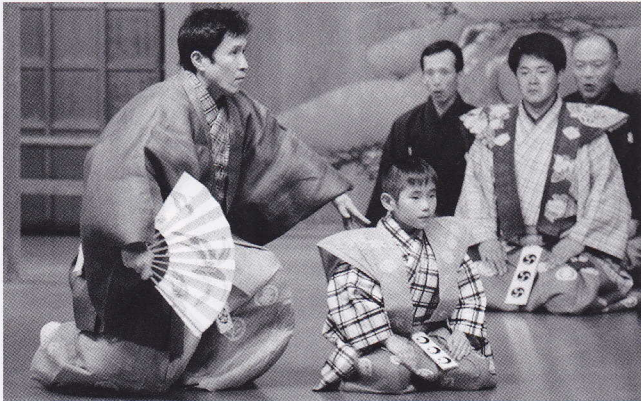
昨年の大阪公演より「牛盗人」

金津の里のある男が、お堂に安置する地蔵を求めに都へ行きます。大声で仏師(仏像を彫る人)を探し歩いていると、すつば(詐欺師)が近付き、自分が仏師だと偽って注文を聞きます。すつばはちやうどよくできた地蔵があると買って売ります。渡しますが、それは地蔵に成りすましたすつばの子どもでした。そうとは知らない金津の男は喜んで帰り、村人を集めて地蔵を拝んでいると……。