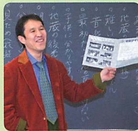
小笠原先生はプロの狂言演者