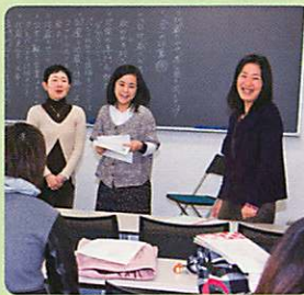
柴先生、兼岡先生から授業のまとめ

千葉の伝統文化に触れることができました。大学は県外の学生も多いのですが改めて千葉を知ることができて良かったと思います。自分たちの活動を学長や理事の先生、各施設の方にアピールするのはなかなかない機会ですので、この経験が社会に出てからも役に立つと感じています。