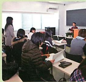
学生から次々に鋭い意見が出てきます